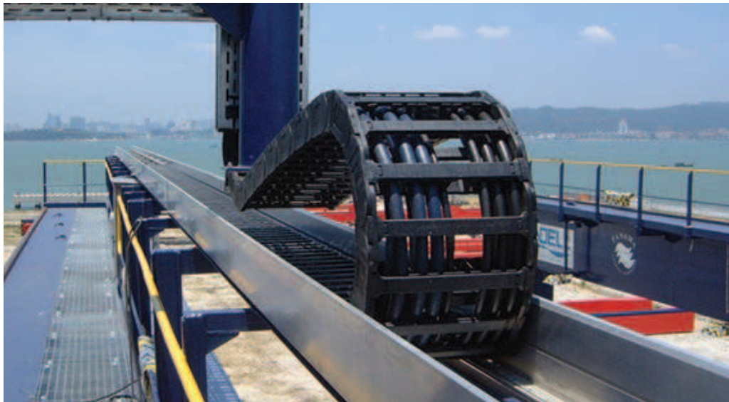
Serie E4 in einer seewasserbeständigen igus® Super-Aluminium-Führungsrinne